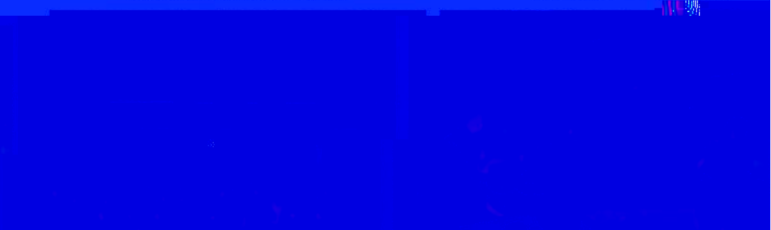
和香港税务学会合影