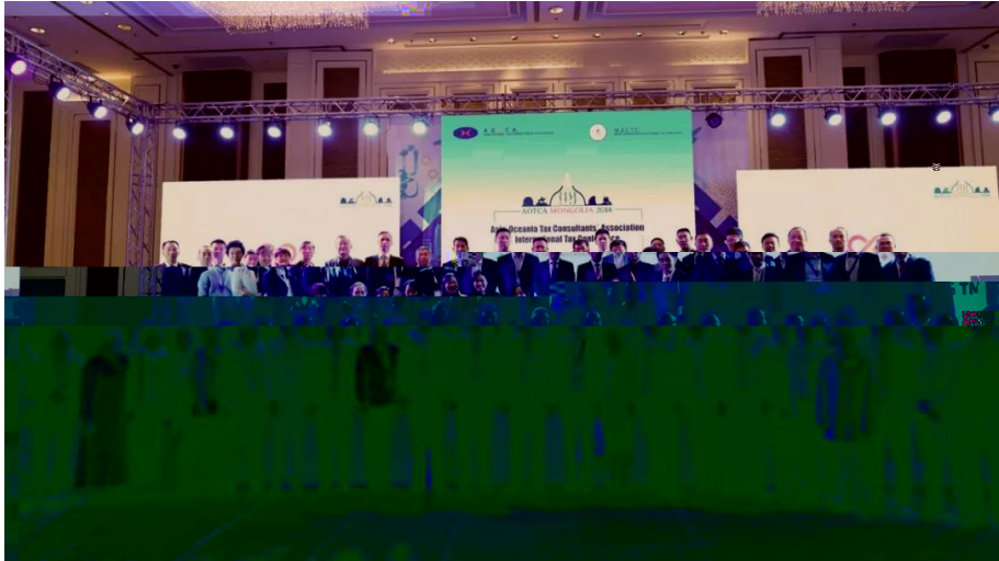
▲ 中税协代表团合影